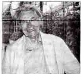
Charles, 76 ans, membre improvisé du jury du slam. « C'est vivant. Une forme de poésie sans prétention. »

Je trouve ça très vivant, très intéressant. J'ai noté selon mes goûts. On voit tout de suite ce qui est bien inspiré, bien dit. Pour certains jeunes, c'est prometteur. Je préfère l'émotion personnelle qui se dégage des textes, plutôt que l'émotion