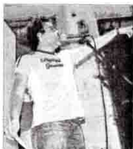
Le slameur est libre de dire son texte comme il l'entend, en 3 minutes maxi : à la manière du rap, chanté ou lu...

Lieu Unique, quai Ferdinand-Favre, à Nantes, près de la Cité des congrès.